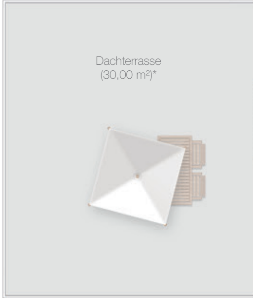
Dachterrasse (30,00 m 2 )*